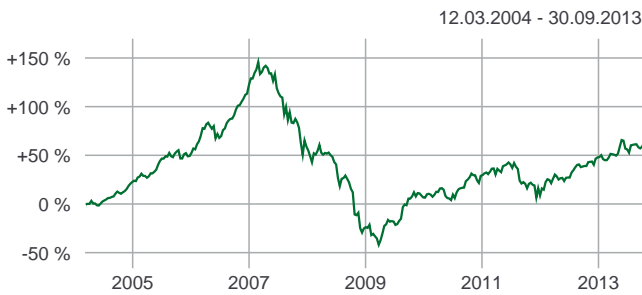
Rahaston volatiliiteetti, 1 vuosi 12,8 %